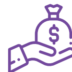
Devolución de las Primas pagadas