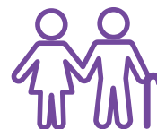
Ahorro para La jubilación