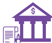
Endoso a favor de entidades del sistema financiero por créditos hipotecarios en reemplazo de un seguro de desgravamen